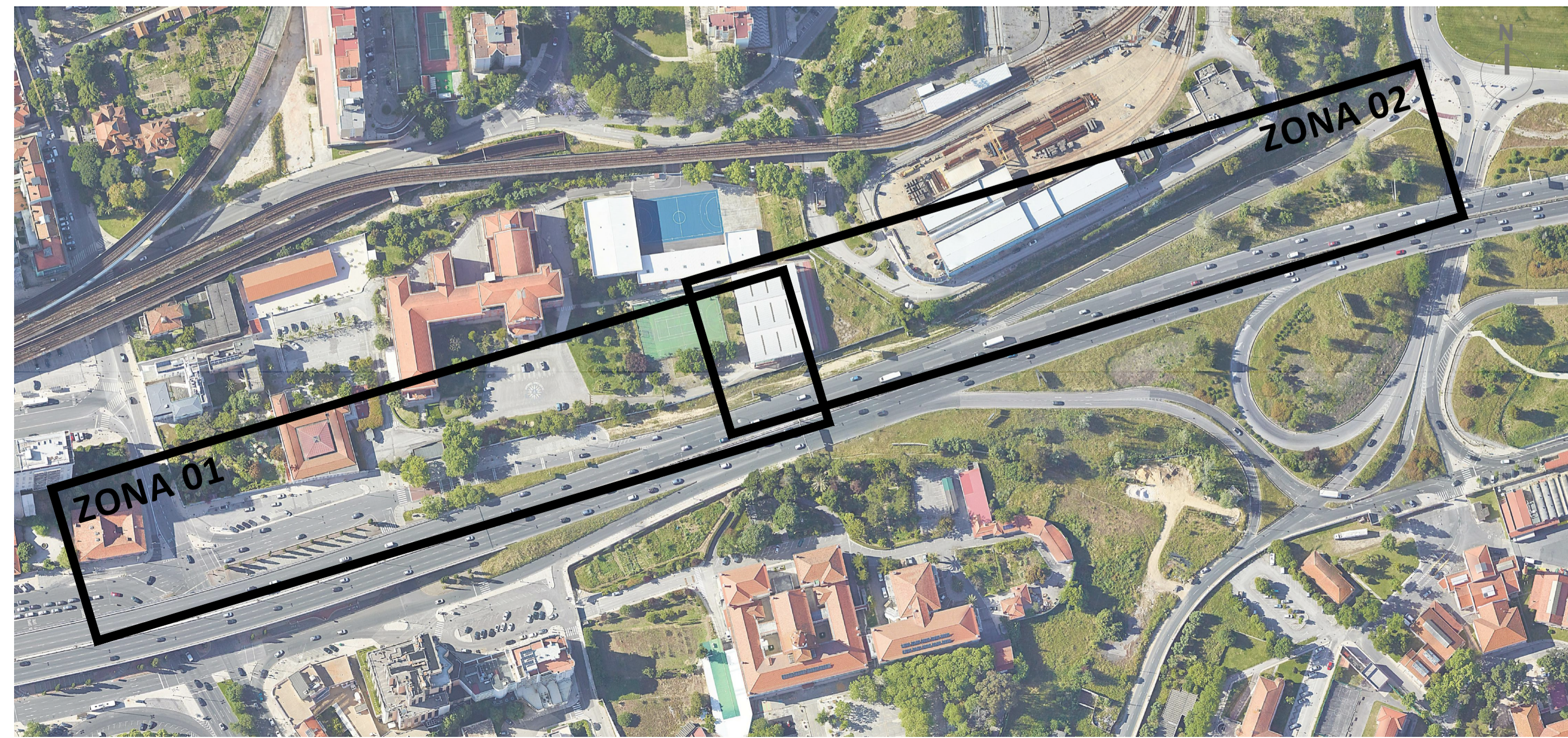
Localização das ZONAS 01 + 02 - Av. Marechal Craveiro Lopes / Calvanas