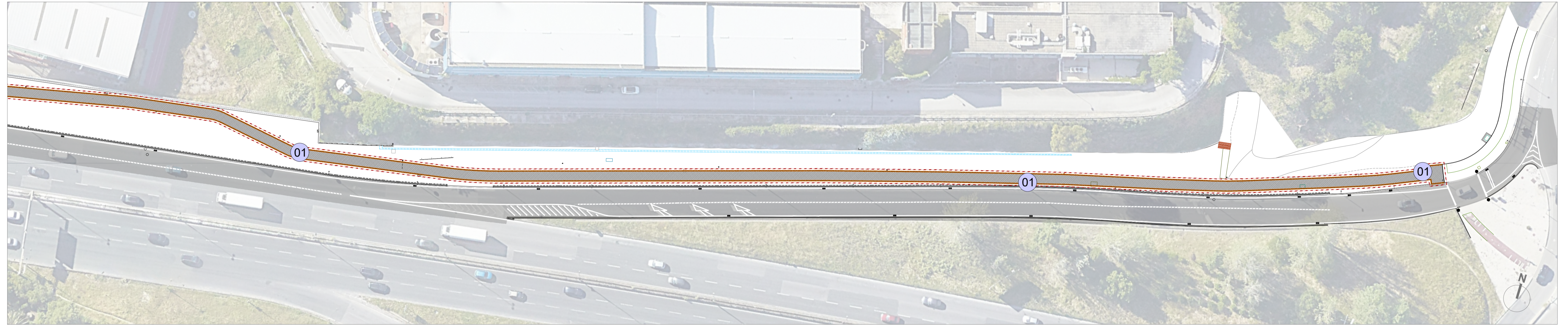
ZONA 02 - Av. Marechal Craveiro Lopes / Calvanas ESCALA 1:500