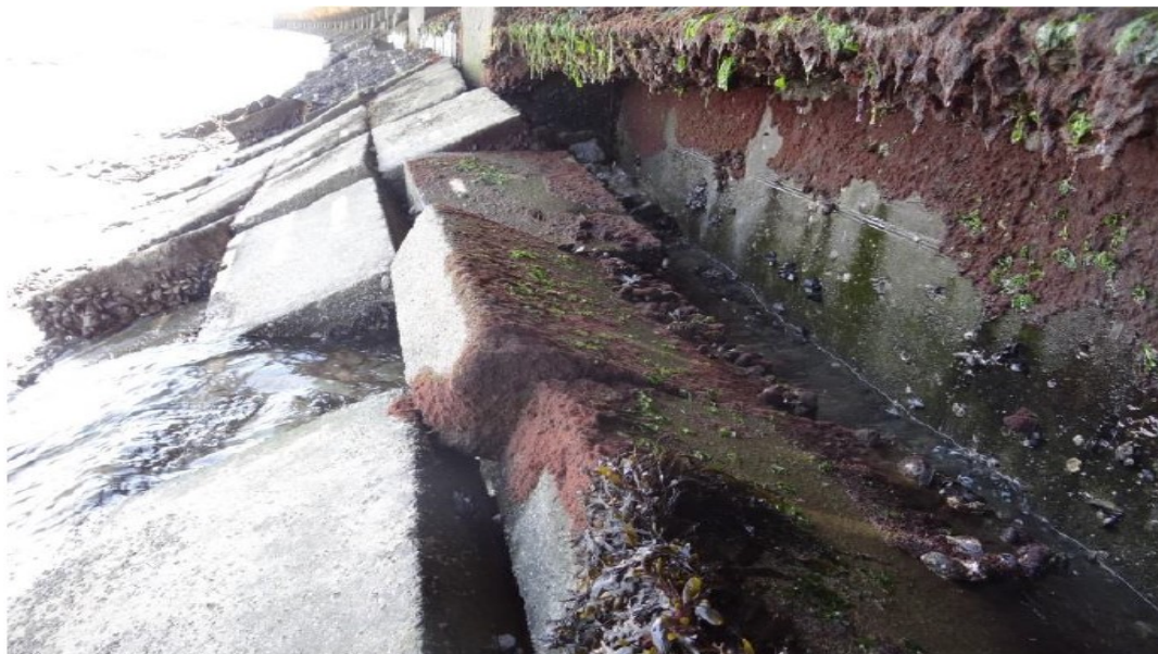
Figura 3 – Pormenor da face exterior do dique