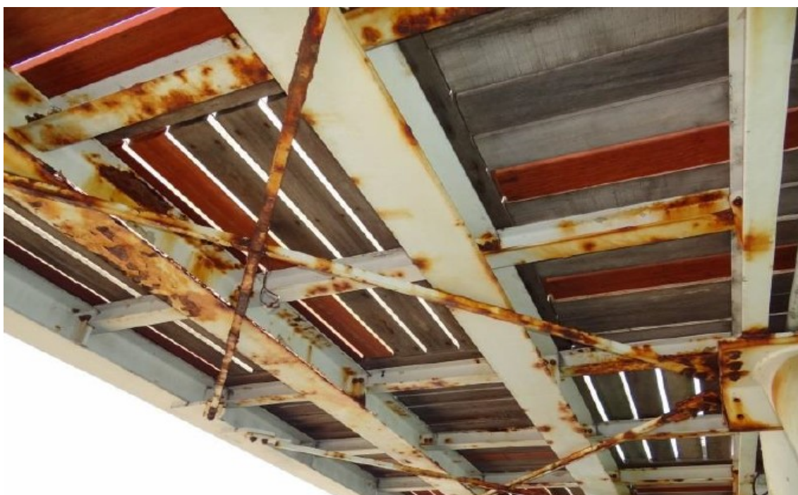
Figura 6 – Vista inferior do tabuleiro metálico