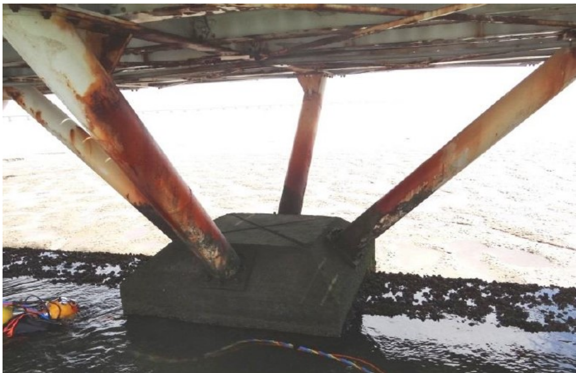
Figura 5 – Vista dos perfis tubulares de apoio da estrutura