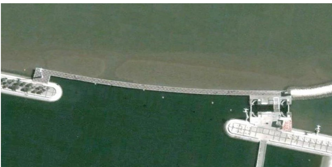
Figura 2 – Vista aérea da obra