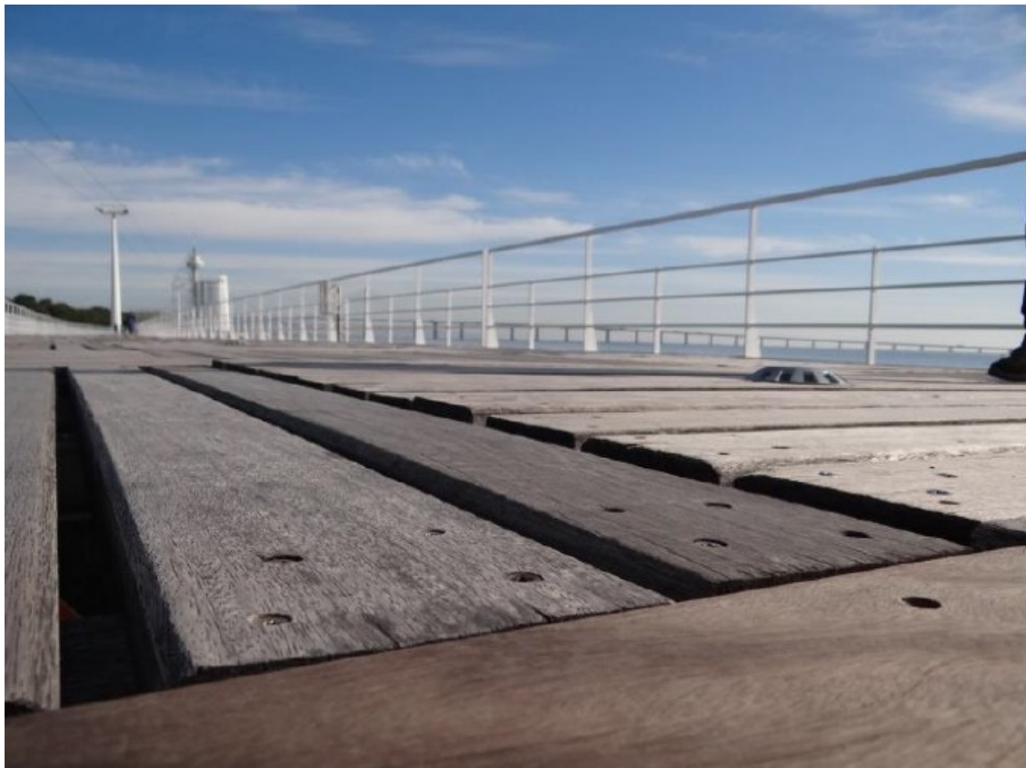
Figura 7 – Pormenor de desnível no revestimento de madeira