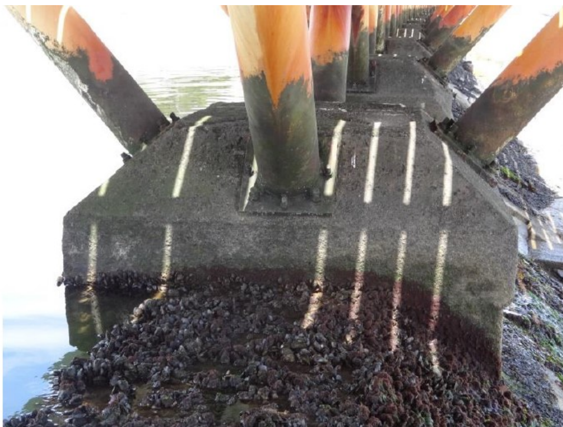
Figura 4 – Vista de um dos maciços da estrutura